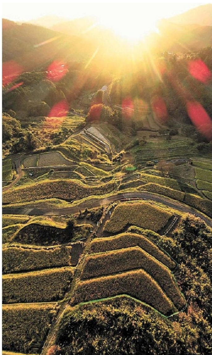
夕暮れで黄金色に輝く久留女木の棚田の稲穂＝11日午後5時ごろ、浜松市北区引佐町