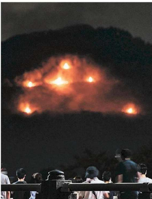
都の伝統行事「五山送り火」で6カ所の「火床」に点火された「大文字」 ＝16日夜、京都市

お盆に迎えた先祖の霊を送り出す京都の伝統行事「五山送り火」が16日、京都市街を囲む山々で行われた。昨年に続き、新型コロナウイルス対策で見物客の密集を避けるためとして、六つある文字や形の1つ当たりの点火箇所を大幅に削減した。市内を流れる鴨川の橋の上や河原では、マスク姿