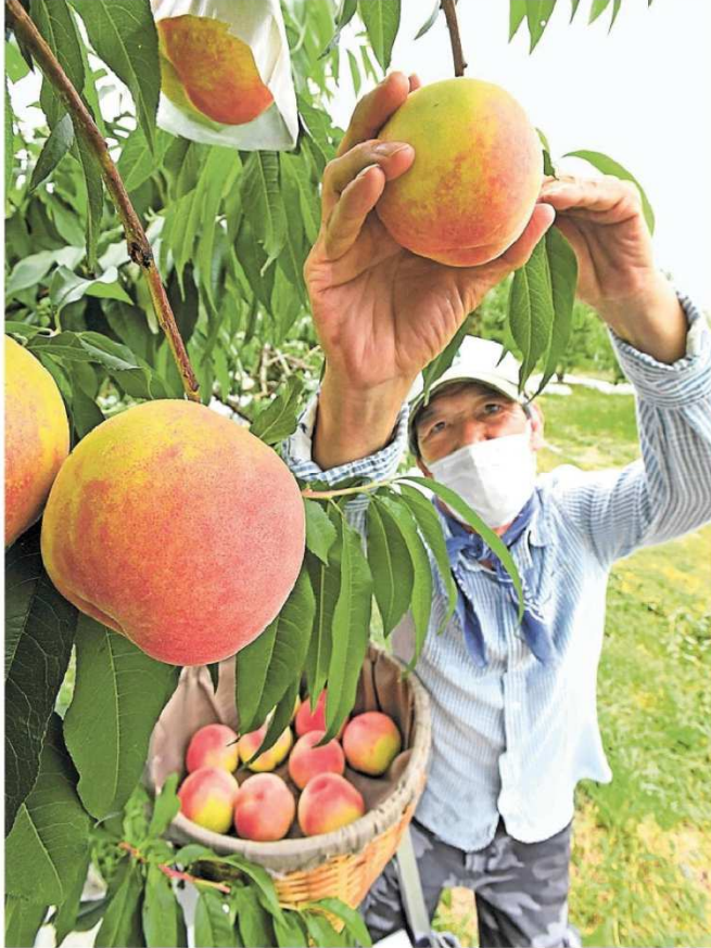
収穫が行われる桃。夏至の県内は朝から雲に覆われた。21日午前 静岡市駿河区