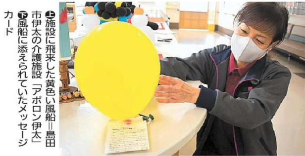
④施設に飛来した黄色い風船＝島田市伊太の介護施設「アポロン伊太」 ⑤風船に添えられていたメッセージカード