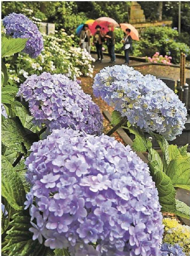
雨に濡れ彩りを増すアジサイ 14日午前9時50分、焼津市坂本の林叟院