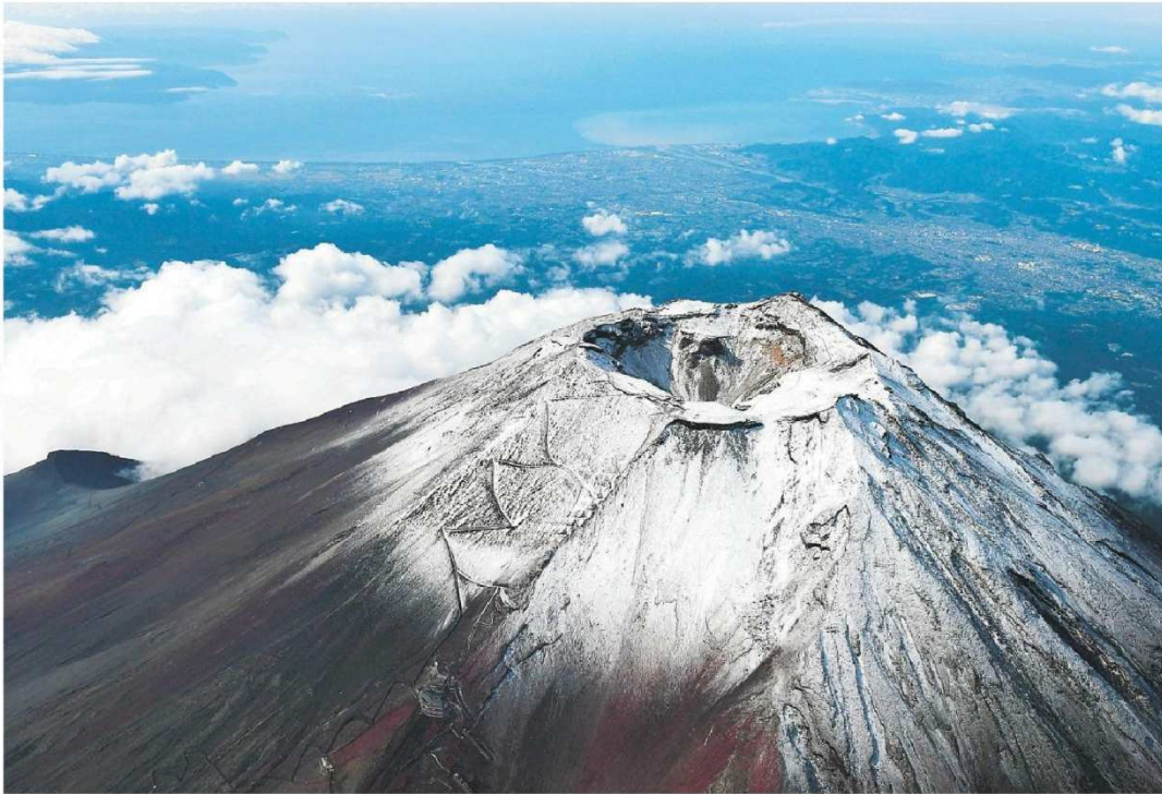
初冠した富士山。静岡、山梨県境付近から駿河湾（奥）を望む 117日前8時半ごろ（本社ヘリ「ジェリコ1号」から）