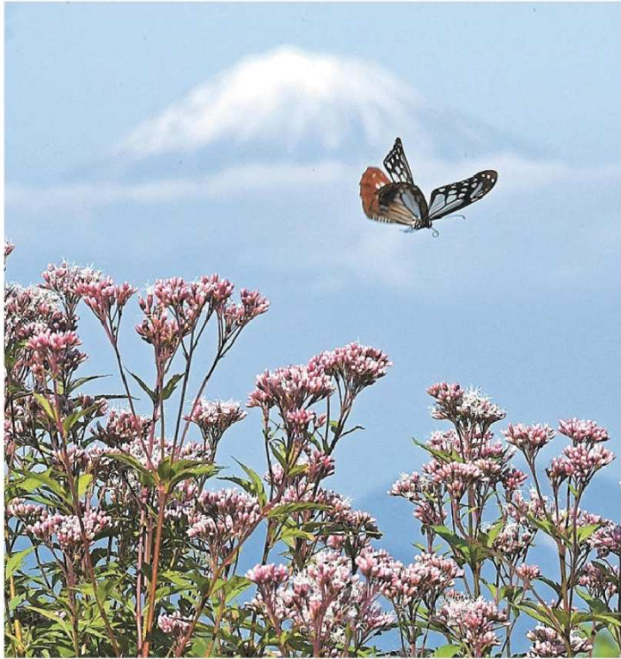
冠雪した富士山を背にフジバカマの蜜を求めて飛ぶアサギマダラ 20日午後、静岡市清水区の日本平夢テラス庭園