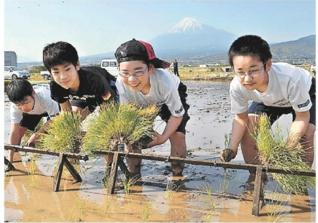
豊作を願い、水田に苗を植え付ける生徒。富士市

や職員のアドバイスに従って約400平方メートルの水田に苗箱16枚分の苗を植え付けた。9月ごろには240キロほどの米が実る見込みで、生徒は収穫にも取り組む。