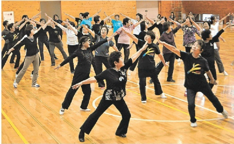
腕を上げて富士山を表現する参加者—富士市立富士南中

県体操祭(11月3日)に先立ち、「しずおか賛歌」富士よ夢よ友よ」に合わせて体を動かす「静岡体操」の公開練習会が7日、富士市の市立富士南中で開かれた。静岡市駿河区