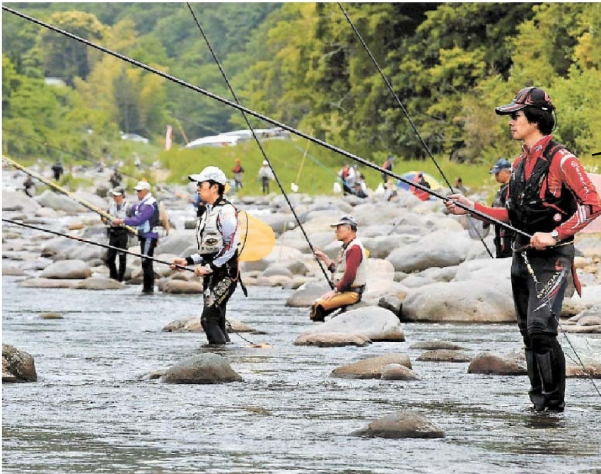
大物を狙いさおを繰り出す愛好家—20日、伊豆市門野原の狩野川