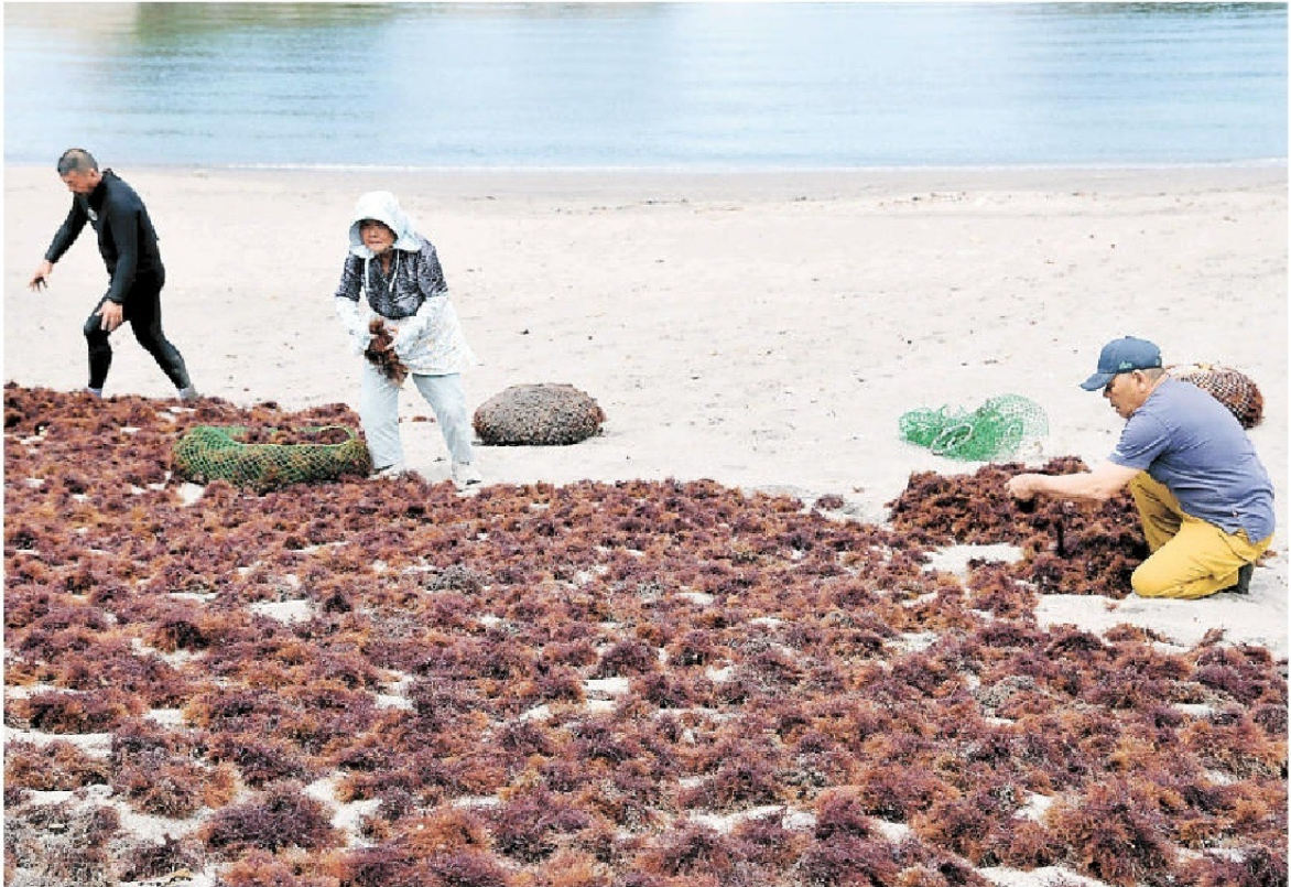
テングサを天日干しする地元住民—西伊豆町