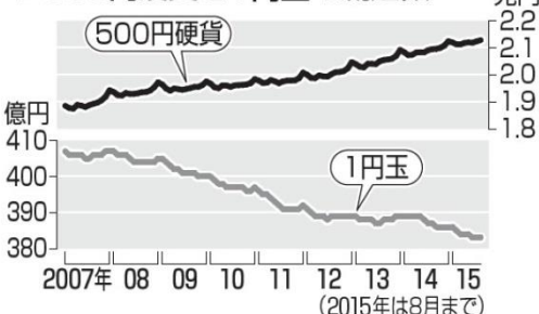
●500円硬貨と1円玉の流通額